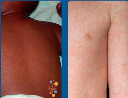
Si mund të duket një skuaje nga fruthi

Fruthi zakonisht shfaqet me simptoma të ngjashme me ato të ftohtit që pasohet më tej nga një skuaje. Disa njerëz gjithashtu mund të kenë pika të vogla në gojë. Ndonjëherë mund të shkaktojë ndërlikime serioze si verbëri, pneumoni, meningjit dhe sepsis, duke e rrezikuar seriozisht jetën.